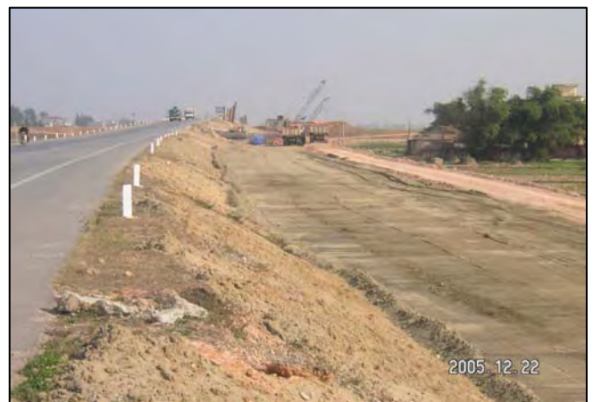
写真-3 ベトナム国(道路工事)現場/施工管理実績

当社では1級及び2級土木施工管理技士をはじめ、旧道路公団の施工管理員B級・C級等の資格を持つ経験豊富な社員が国内外の現場で従事しています。また社員には技術者倫理を徹底し、VE教育や安全管理教育にも力をいれています。