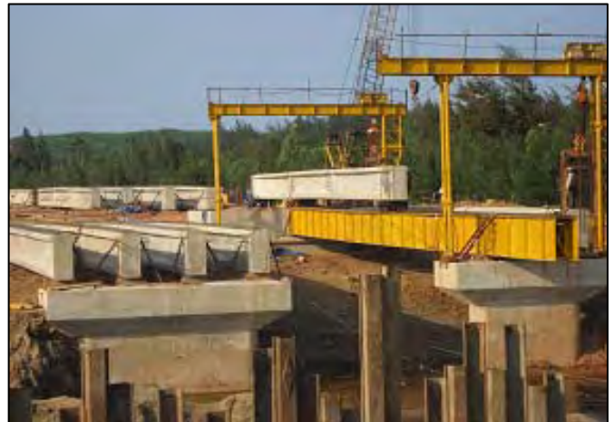
写真-2 ベトナム国(橋梁工事)現場/施工管理実績

施工管理受託者(会社)は工事現場の状況について精通した技術者を配置し、正確にかつ厳正に諸要素を満足させなくてはなりません。