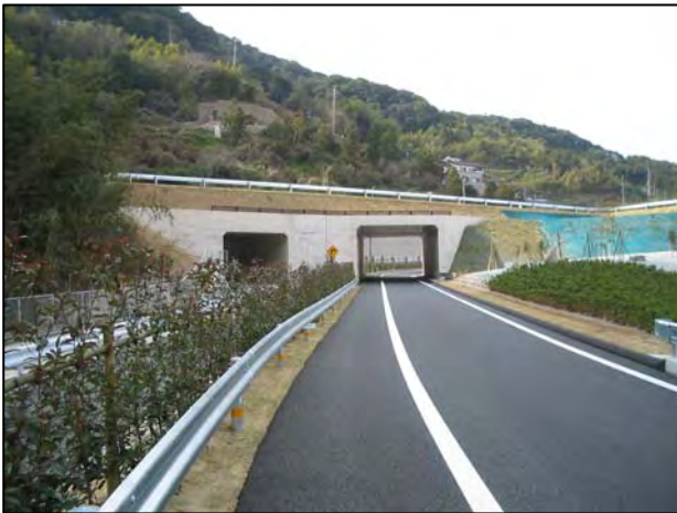
写真-1 旧 JH 長崎工事/施工管理実績