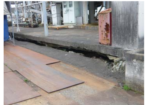
写真-1 地盤沈下による構造物の開口状態

今回、今後の沈下挙動の予測を行い、沈下対策の提案を行うことを目的とした調査を実施しましたので、ご紹介します。