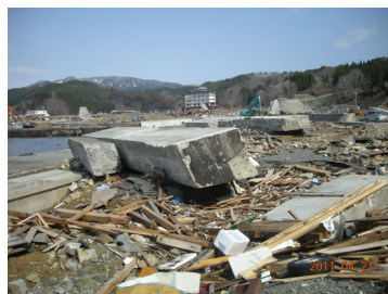
津波により破壊された津波防潮堤