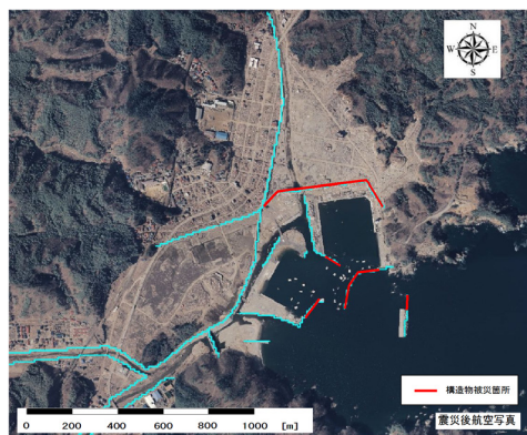
津波襲来後の航空写真

津波シミュレーションにより、防潮堤は第1波をくい止め、避難のための時間を数分かせいでいたことに加え、水位を数メートル下げた効果があったと考えられます。